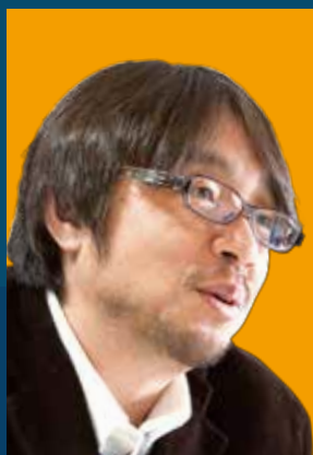
小山 薫堂 氏

放送作家・脚本家としてテレビや映画での活動の他、ライフスタイル誌のエッセイ連載、小説、絵本翻訳、作詞など、幅広い執筆活動も展開。また、京都市のアンテナショップ「京都館」の館長を務めるとともに、老舗料亭の経営者として京都ならではのおもてなしを実践している。平成26年4月に京都観光おもてなし大使に就任。