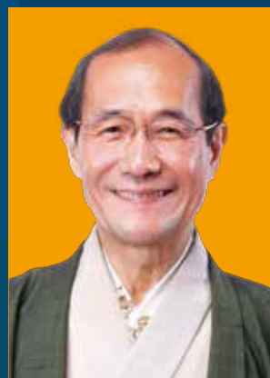
門川 大作 京都市長

創業1675年の伏見で最も古い蔵元のひとつで最古の蔵元である清酒「月の桂」醸造元14代目当主。日本酒や和食を通じて京都の魅力の世界に向けて発信し、世界中からの研修旅行、京都を知ってもらうためのツーリズムを招聘している。平成27年9月に京都国際観光大使に就任。